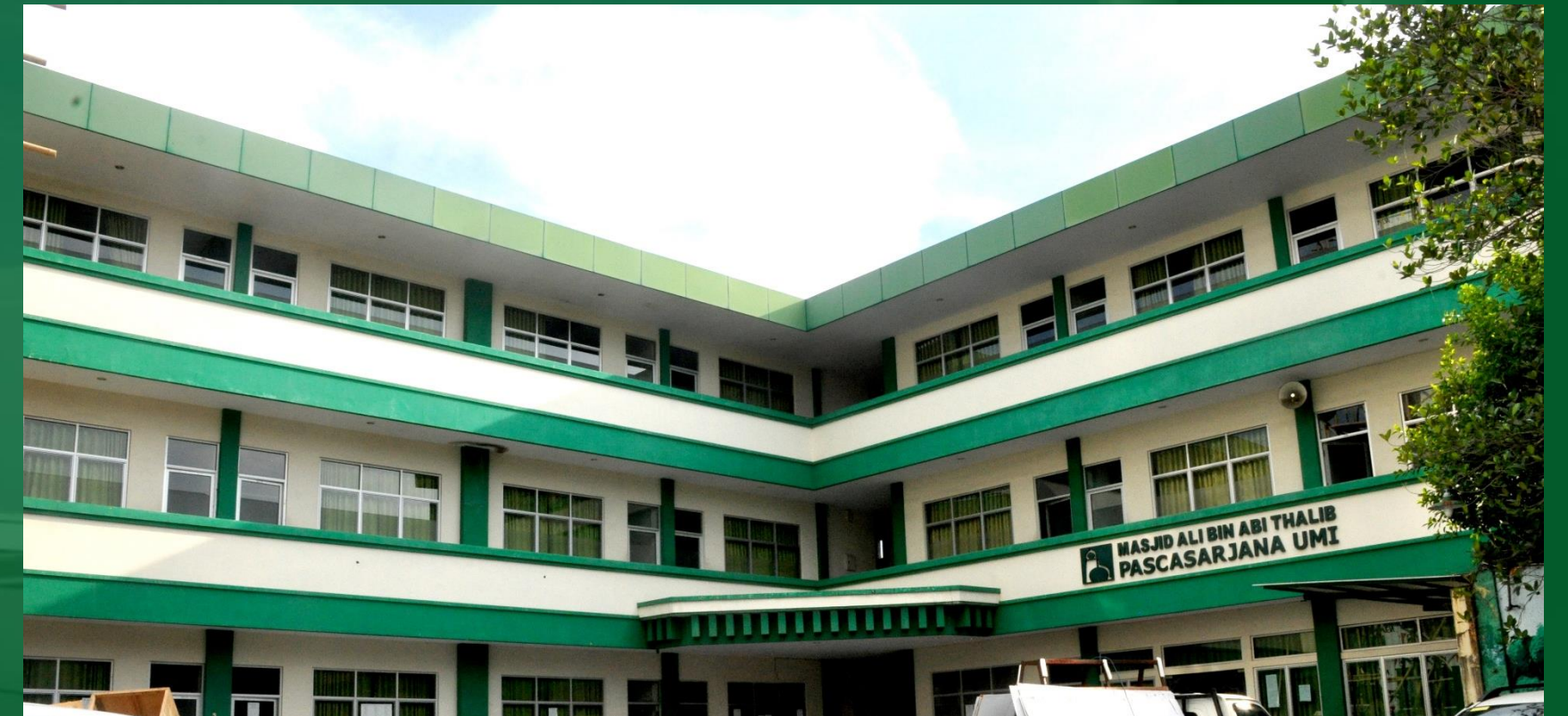
GEDUNG PASCASARJANA UMI